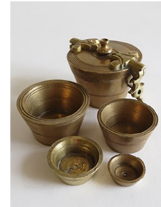
Poids en godet MUSÉE DES AUGUSTINES

✓ 5 et 6 juin 2017 – Congrès annuel de l'Association des facultés de pharmacie du Canada (AFPC). Centre des congrès de Québec