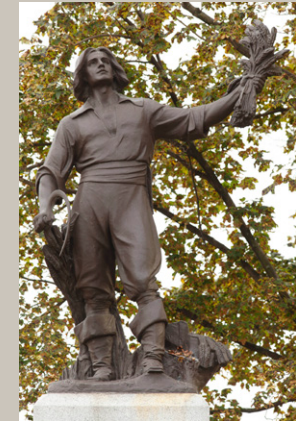
Monument Louis Hébert

Un parcours pédestre Sur les traces de Louis Hébert et de Marie Rollet met en valeur l'histoire de la famille pionnière en la localisant dans ses différents