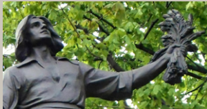
Monument Louis Hébert, premier colon du Canada.

C'est ici à Québec le 4 juillet 1617, que la première famille française est arrivée. Nous voici en 2017, prêts à célébrer le 400 e anniversaire de l'arrivée de Louis Hébert, de Marie Rollet et de leurs trois enfants en Nouvelle-France.